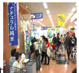
オーセンテックの自動純水給水器